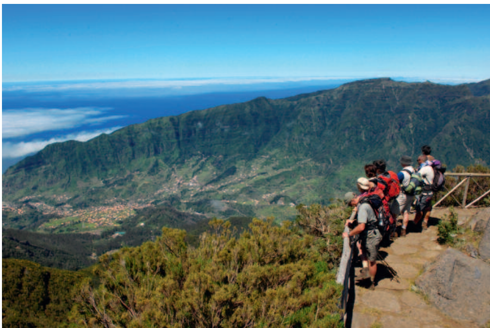
4 jours de programme découverte au départ de Funchal : Promenades en Jeep, randonnées et/ou catamaran, des excursions accessibles pour tous et 3 jours d'escapade en liberté en voiture depuis un hôtel en pleine montagne.