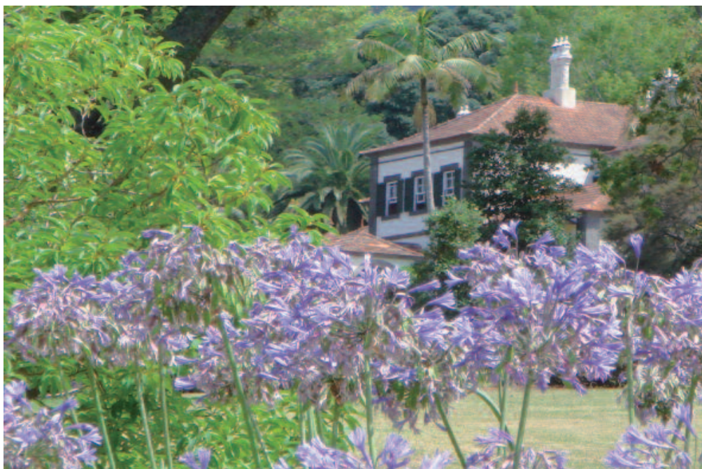
Cet itinéraire individuel est conçu pour les voyageurs désireux de découvrir en toute liberté les merveilles de Madère, véritable jardin sur l'océan, tout en séjournant dans des hôtels de charme et des adresses authentiques sélectionnés avec soin.

JOUR 1 : FRANCE - FUNCHAL - SANTO DA SERRA (ENV. 15 KM) Arrivée à l'aéroport de Funchal, accueil par notre représentant et mise à disposition du véhicule pour rejoindre Santo da Serra. Repas libres. Nuit à l'hôtel.