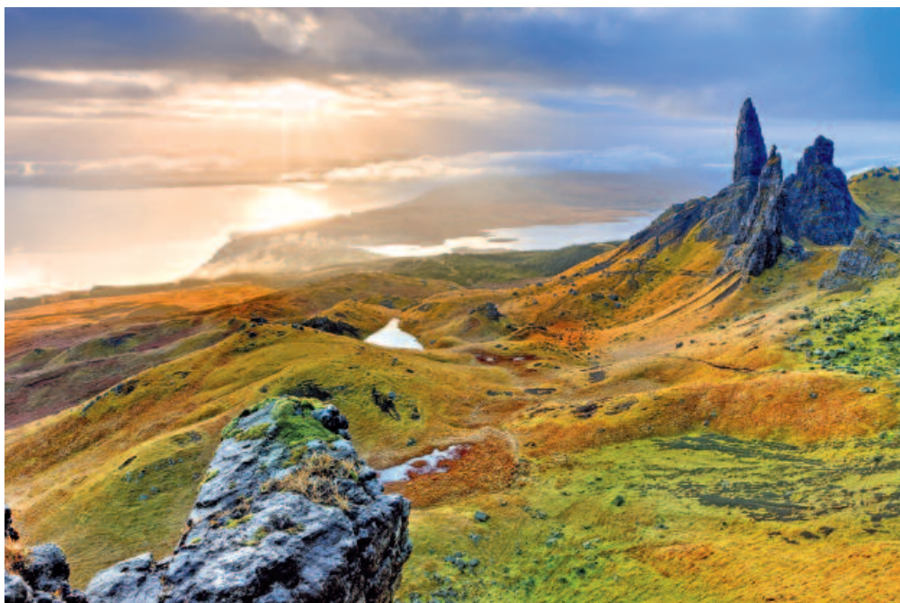
D'Édimbourg vers les Highlands, des îles de la côte ouest jusqu'à Glasgow, ce circuit est un très beau panorama sur l'Écosse, alternant paysages de légendes et visites incontournables. Idéal pour une première découverte de la destination.

7 nuits, repas selon programme | 1745 € TTC à partir de